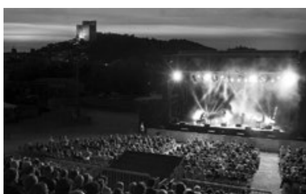
↓ Grande scène Crest Jazz Festival