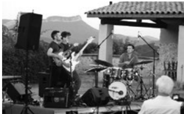
↓ Jazz au village à Cobonne