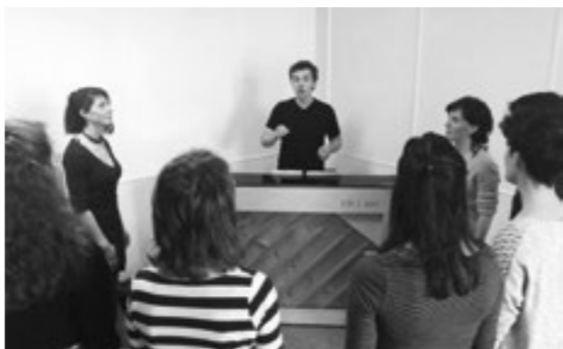
↓ Cours de l'École de la voix, Crest