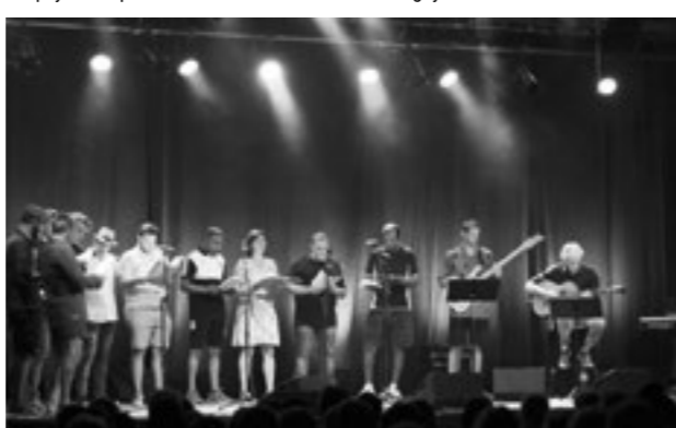
↓ Concert de restitution de l'atelier jazz vocal avec des patients de l'hôpital psychiatrique Sainte-Marie de Privas