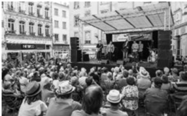
↓ Concours jazz vocal du Crest Jazz Festival