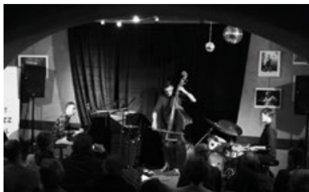
↓ Jazz club au restaurant La Tartine, Crest