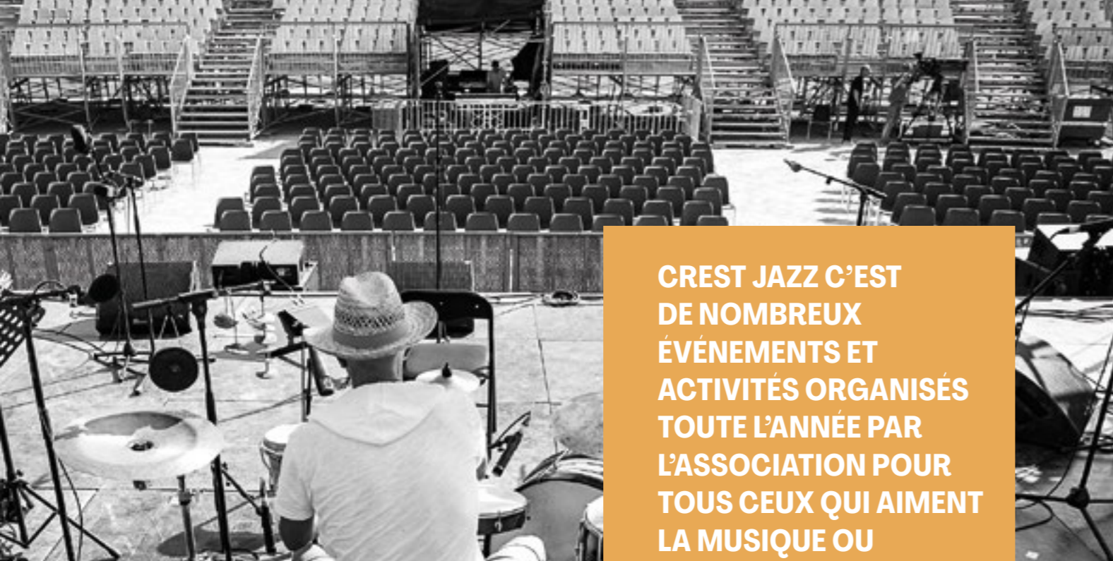
↑ Installation de la grande scène du Crest Jazz Festival

CREST JAZZ C'EST DE NOMBREUX ÉVÉNEMENTS ET ACTIVITÉS ORGANISÉS TOUTE L'ANNÉE PAR L'ASSOCIATION POUR TOUS CEUX QUI AIMENT LA MUSIQUE OU LE CHANT !