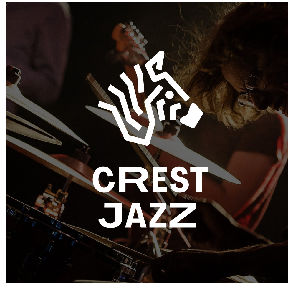
Exemple : sur photo avec voile sombre.