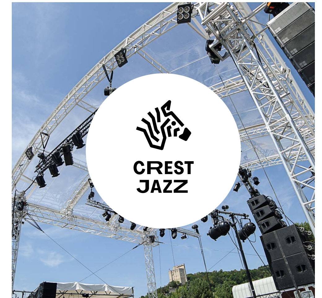
Exemple : sur photo dans une forme avec aplat.