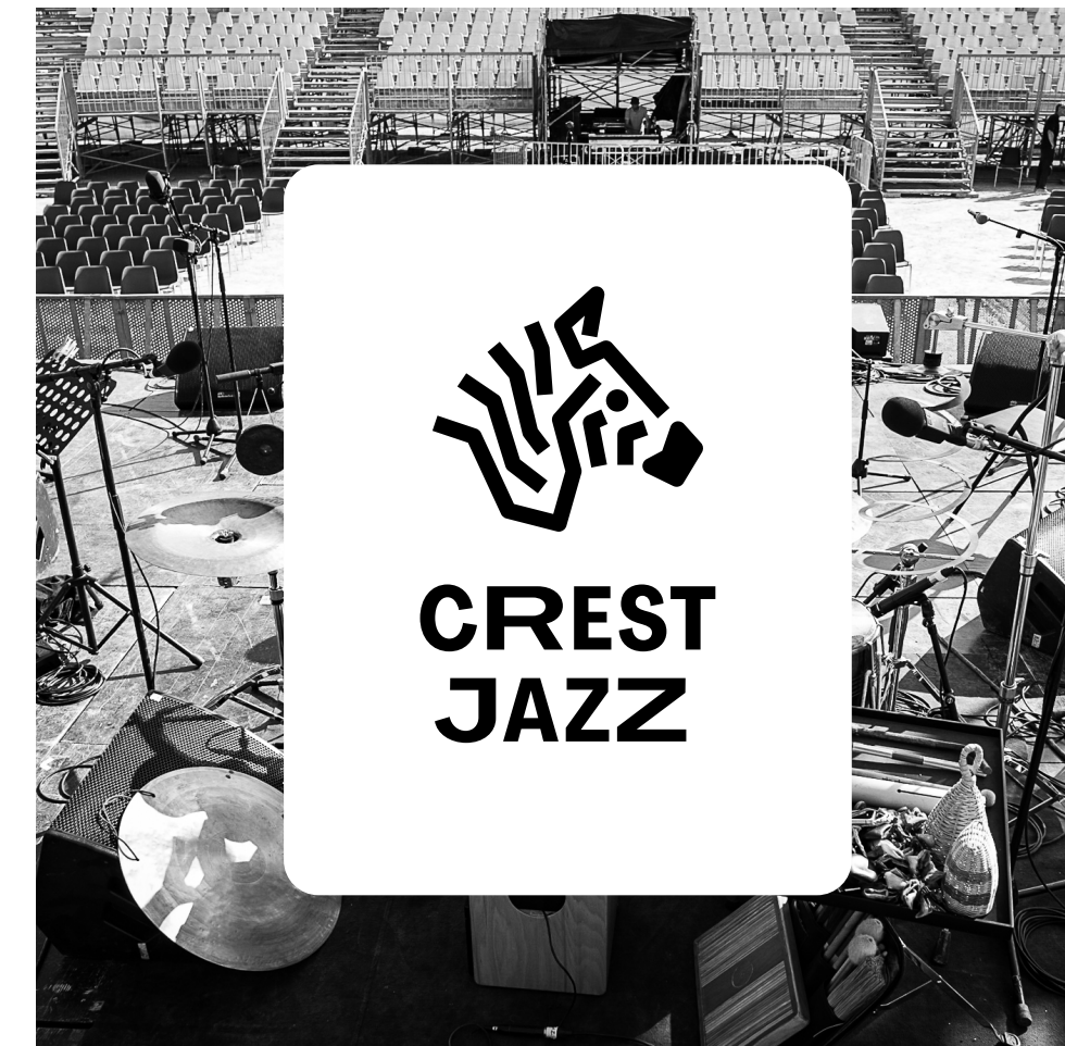
Exemple : sur photo dans un cartouche avec aplat.