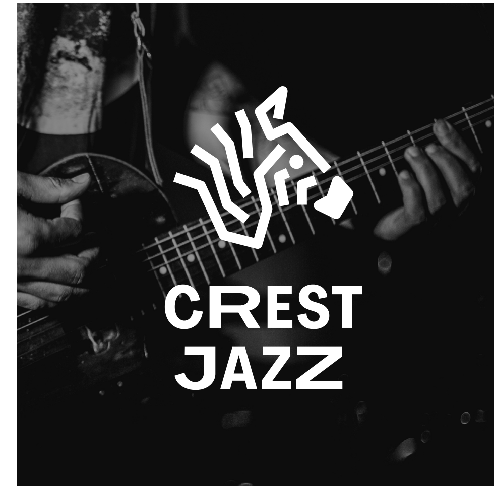
Exemple : sur photo à fond sombre.