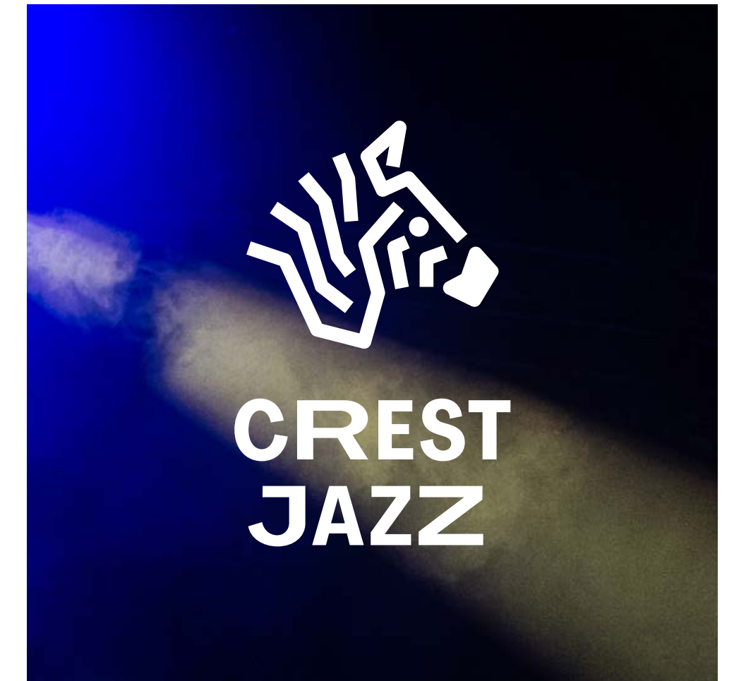
Exemple : sur photo à fond sombre.