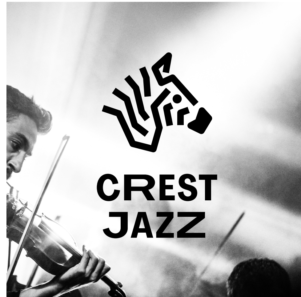
Exemple : sur photo à fond clair.

Si ce n'est pas le cas, le logo doit être utilisé sur un aplat (dans un cartouche par exemple) ou en ajoutant un voile pour assombrir ou éclaircir la photo afin de faire ressortir suffisamment le logo.